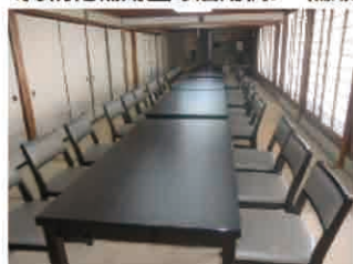
新規顧客獲得のための新設備・什器導入