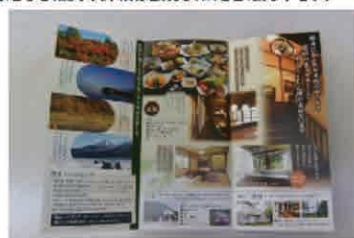
PRの強化を目的としたチラシやパンフレットの作成