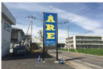
店舗の認知度向上を狙った看板(サイン)の設置