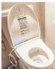
トイレの洋式化改修