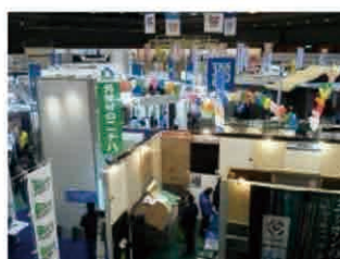
販路開拓のための展示会出展