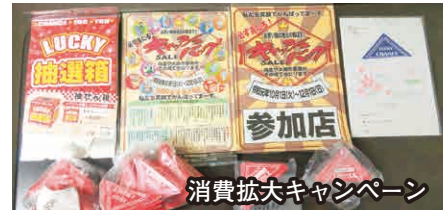
消費拡大キャンペーン

※なお予定していた県外先進地研修(キャッシュレス社会実験研修／向島橋銀座商店街視察)は中止となりました。