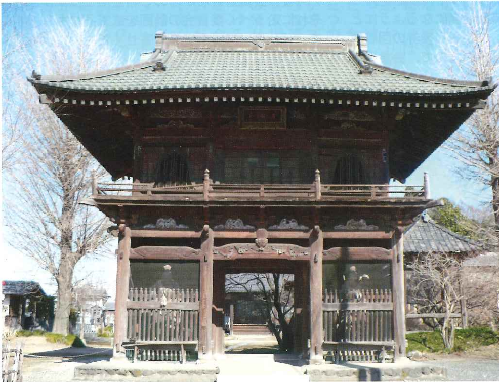
しょうれんじ 青蓮寺

◇発行所 太田市新田商工会 〒370-0341 太田市新田金井町607 TEL0276-57-3535 FAX0276-57-3536 URL: http://www.ons.or.jp e-mail: onitta@ons.or.jp ◇発行者 会長 武井 善作 ◇印刷所 株式会社三菱電機ドキュメンテクス ◇発行日 平成20年3月6日