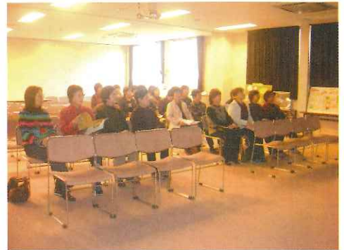
キューピー富士吉田工場にて