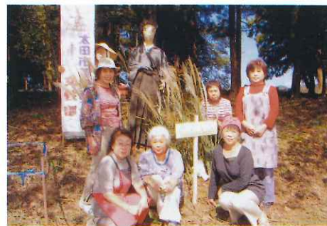
坂本龍馬と記念撮影

その他、尾島ねぶた祭り・にった花トピア・太田市産業環境フェスティバルでも元気にイベントを盛り上げ、女性部は地域の方達とのふれあいを大切にしています。