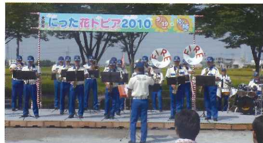
消防音楽隊によるオープニング

夏の猛暑の影響で水が不足し、開花状況が心配されましたが、延べ 7 万人の来場者があり、頑張ってくれた花達が今年も大勢の人の目を楽しませてくれました。最後の 3 日間はフラワープレゼントデーで摘み取りができ、持ち帰られた各家庭を和ませてくれたことでしょう。