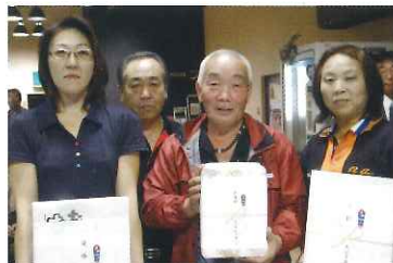
団体優勝の平野工業所のみなさん個人戦でも1位から3位を独占!