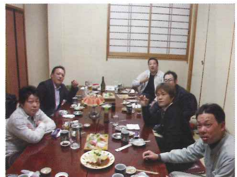
和気藹々と23年度事業について語り合う青年部員