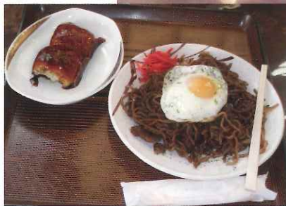
木崎宿やきそばランチ (500円)