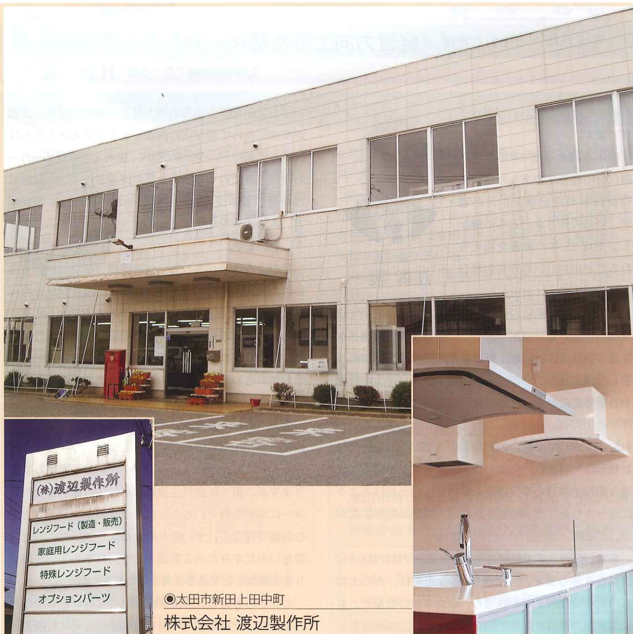
●太田市新田上田中町 株式会社 渡辺製作所