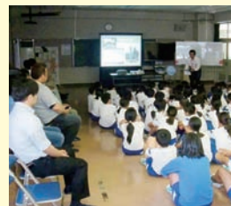
尾島小ねぶた訪問指導

今年も尾島小学校の5年生を対象に、ねぶたの製作指導を行いました。地域に伝わるまつり文化を、ねぶたを作り上げることによって、子供たちにも体験してもらうことができました。