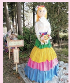
かかし祭り祭品作品