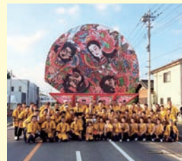
尾島ねぶたまつり

今年は初めての試みとして、金魚ねぶたコンテストで受賞した一般の方に、行列に参加してもらいました。地域住民を巻き込んでまつり盛り上げることで、青年部として意義あるものにすることができました。