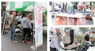
太田市産業フェスティバル

建設部会では、先ずやぶづか産業祭【11月8日(日)・藪塚本町中央公民館駐車場】と太田市産業フェスティバル【11月15日(日)・太田市新田文化会館・総合体育館「エアリス」駐車場】に参加して、イベント価格でプロによる網戸の張替を行いました。天候には恵まれませんでした。15名55枚の張替をさせて頂きました。毎年の事業ですので来年は是非ご利用下さい。