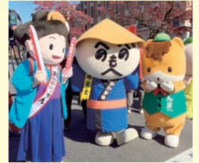
かかまるのイベント出演