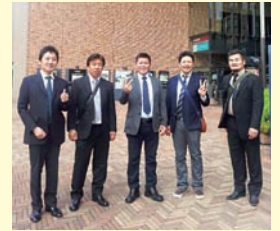
商工会青年部全国大会