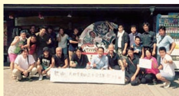
弘前ねぶた交流事業