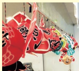
金魚ねぶたコンテスト

本場弘前のねぶたは老若男女が一体となり、地域全体でまつりを楽しんでいるように思えました。この風習を、尾島のねぶたまつりにも浸透させていきたいです。