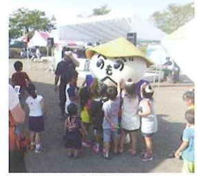
かかまる ゆるキャラグランプリ2013 総合886位 これからも応援よろしくね！

当日は天候も良く、部員一丸となり大きい声で呼び込みをし、各持ち場の担当者も頑張り、14時過ぎには予定の300食を完売しました。来場者の方みなさんに喜んでもらえて、とても良い事業を企画できました。