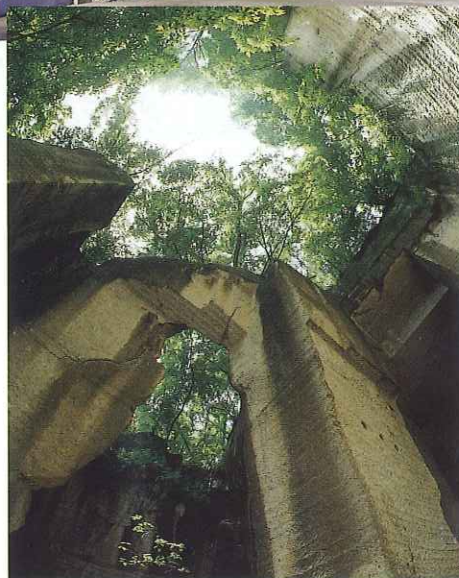
当社イメージ (藪塚石切場)